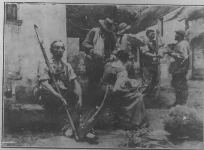
Lhermitte.—"El pago de los segadores".

construido para la exposición de 1900. Hoy lo ocupa el "Museo de la Villa de París".