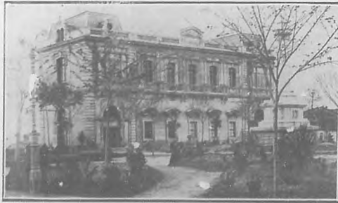
Castropol.—Casino y Parque.

Y por eso Villamil y Castropol honran hoy estas páginas.