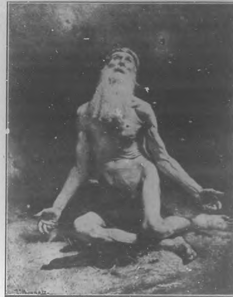
León Bonnat (Job).

En la profusión de obras pictóricas, casi todas de gran mérito, que encierran estas salas, nos lanzaremos á enume-