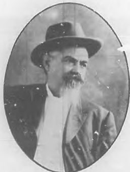
GENERAL ENRIQUE COLLAZO Autor del libro "Cuba Heroica"