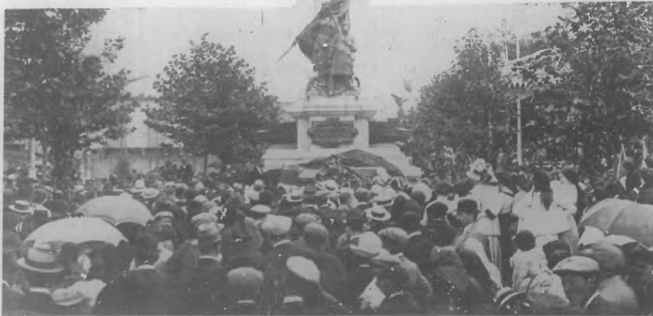
Castropol.—Acto de inaugurar el monumento en honor del capitán de navío de la armada española don Fernando Villaamil y Cueto.